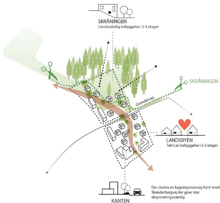
Tidlig ideskitse fra den private udvikler

Aarhus Kommune har forventning om, at udvikling af området vil bidrage til en mere levende og varieret bydel, der kan bidrage til bedre sammenhæng mellem de eksisterende bebyggelser. Udover boliger og erhverv vil der også blive etableret en daginstitution med seks børnegrupper. Boliger vil være både private ejer- og lejeboliger, samt en andel på op til 25 % almene boliger.